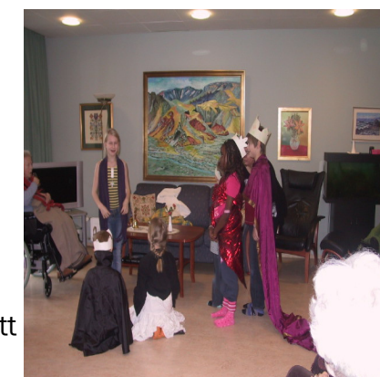
Börn í heimsókn sýna leikþátt

Niðurstöður á gæðavísam Sóltúns má sjá á www.soltun.is