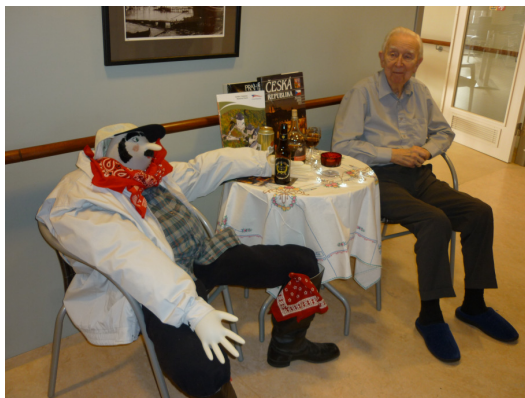
Frá tékknesku þemavikunni

hvernig best er að innleiða það og nota til gæðaumbótastarfs í hjúkrun. Sóltún færir þeim íbúum, ættingjum og starfsfólki kærar þakkar sem hafa lagt þessu verkefni lið.